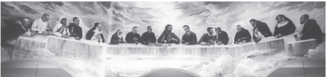
Fresko-sliku svih hrvatskih svetaca i blaženika blagoslovio je varaždinski biskup Marko Culej u zavjetnom svetištu Predragorcjene Krví Kristove u Ludbregu 3. rujna 2005.

Godine 1981. u Rimu je službeno otpočeo kanonski postupak za njegovo proglašenje blaženim i svetim. U listopadu 1998. u hrvatskome nacionalnom svetištu Majke Božje Bistričke papa Ivan Pavao II. proglasio je Alojzija Stepinca blaženikom Katoličke crkve.