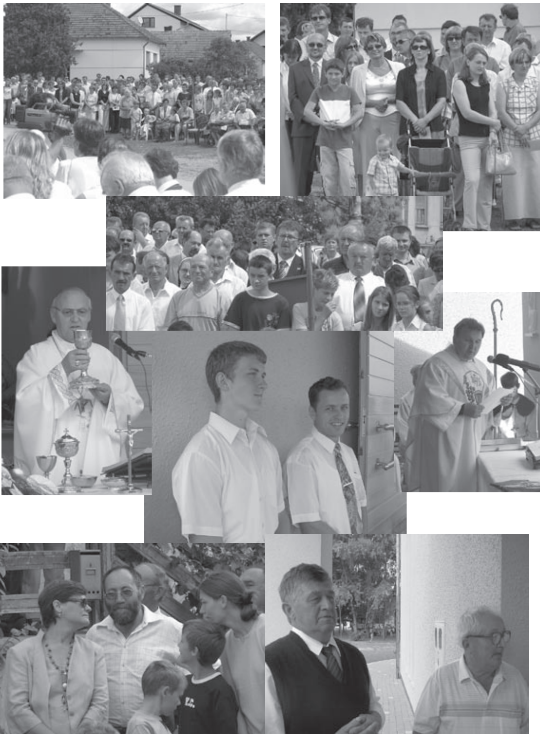
Slike s posvećenja nove kapele u Donjem Pustakovcu