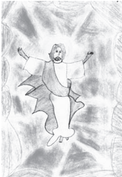
Nacrtala: Lea Bister