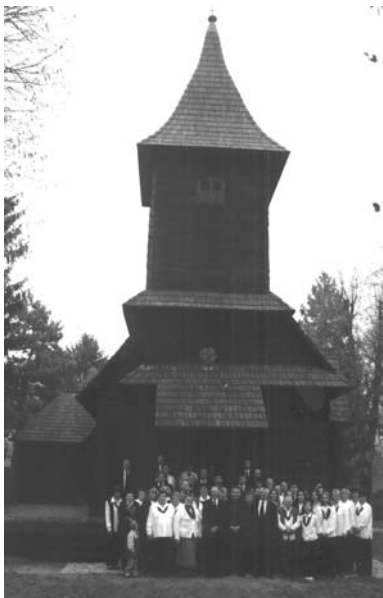
Župni zbor ispred crkve sv. Barbare u Velikoj Mlaci